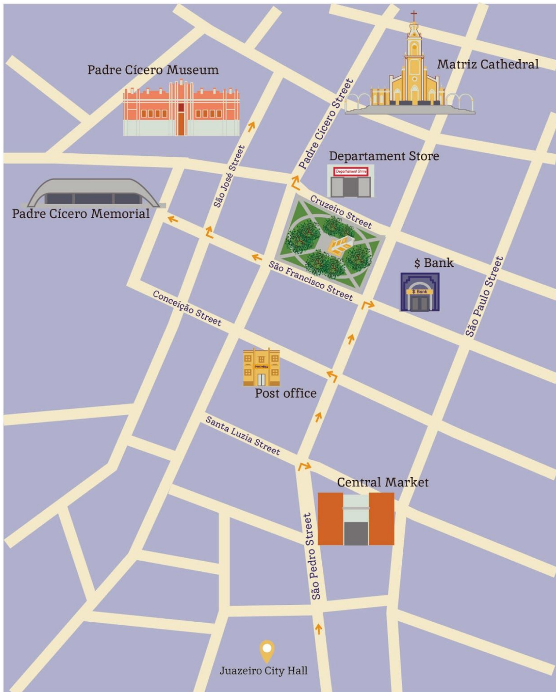
Figura 02 - Mapa do Centro de Juazeiro do Norte